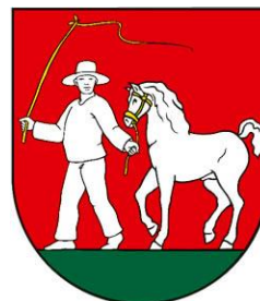
Obrázok 2 Erb obce

Erb obce Zemplínske Hradište tvorí V červenom štíte po zelenej pažiti kráčajúci striebroodetý sedliak v striebornom klobúku, v pravici so zlatým bičom, ľavicou vedúci za zlatú ohlávku strieborného koňa v rovnakej zbroji.